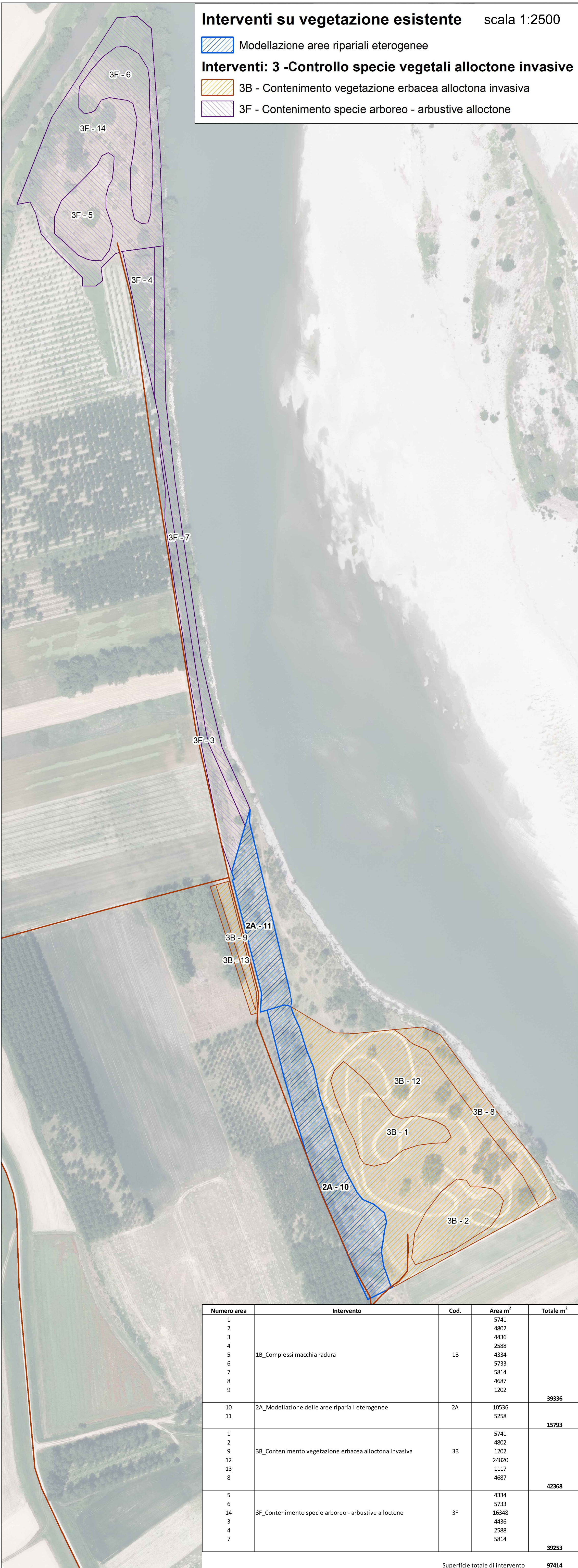
Interventi su vegetazione esistente scala 1:2500