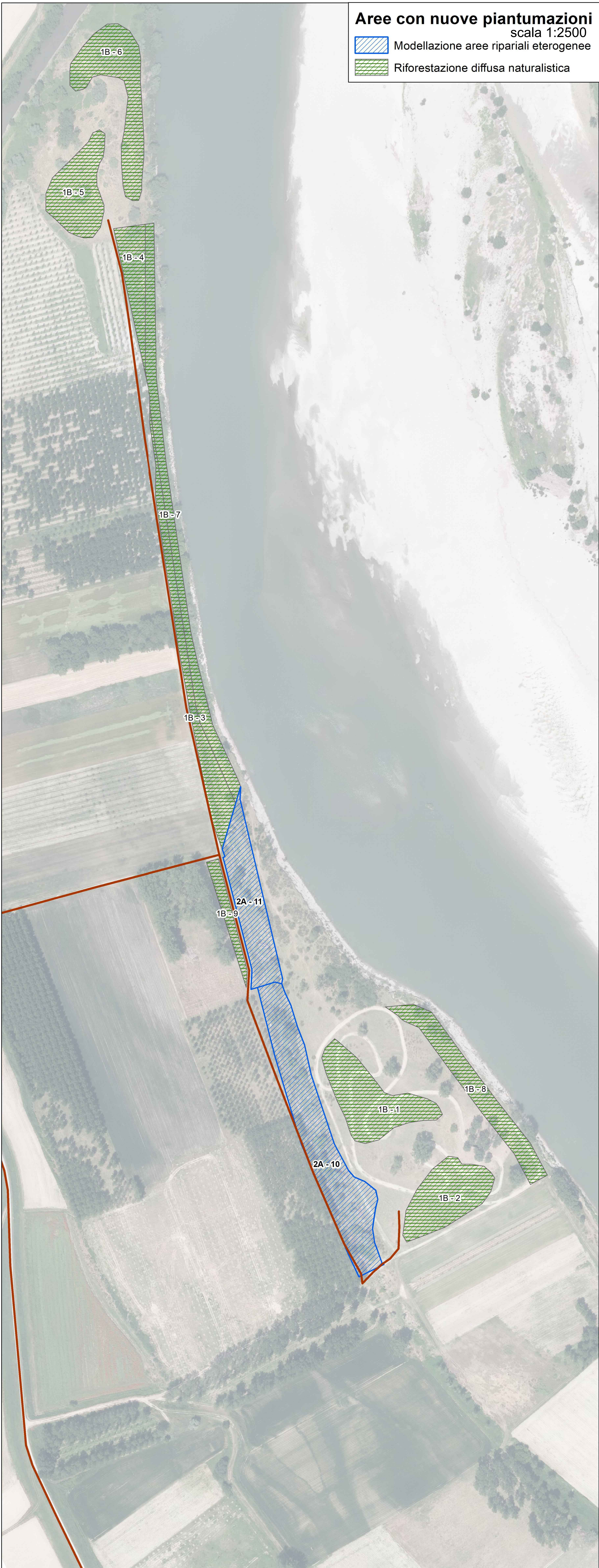
Aree con nuove piantumazioni scala 1:2500